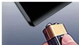
Batería de Emergencia