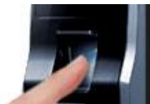
Acceso con Huella