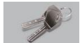
Llaves de Emergencia